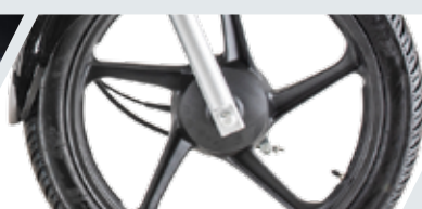
RINES DE ALEACIÓN Y DISEÑO RENOVADO

*Fotografía de referencia, los modelos pueden variar según el país