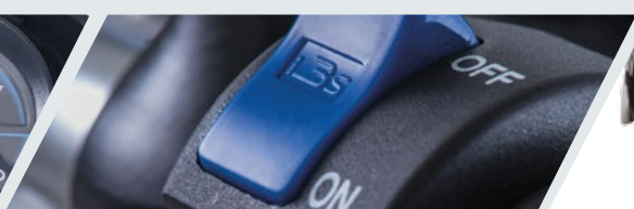
TECNOLOGÍA SMART DRIVE PARA AHORRO DE COMBUSTIBLE